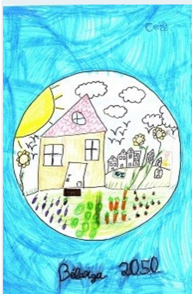
Dessin de Mane, CE2.

Dans le cadre de la révision du P.L.U., qui va conduire le village sur les routes de l'avenir, un concours de dessins à été proposé aux écoles sur le thème « Bélarça 2050 ». De nombreux dessins des enfants illustrent les pages de ce bulletin.