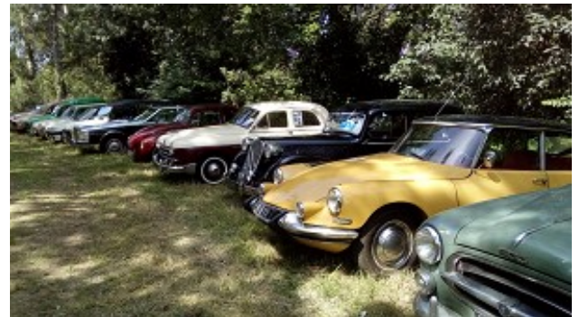
De nombreux véhicules de collection.