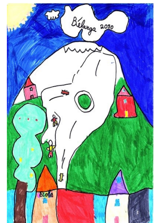
Dessin de Kilian CE1