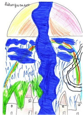
Dessin de Gabriel CE2