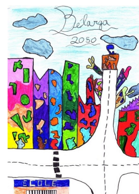
Dessin de Saona CM1

L'association BÉLARG'ARTS a proposé au château un Marché de Noël varié et très convivial à l'occasion de cette quatrième édition. Du vin chaud aux délicieuses pâtisseries, en passant par des créations artisanales et originales, l'association a une nouvelle fois démontré lors de ces 2 journées son savoir-faire et sa convivialité.