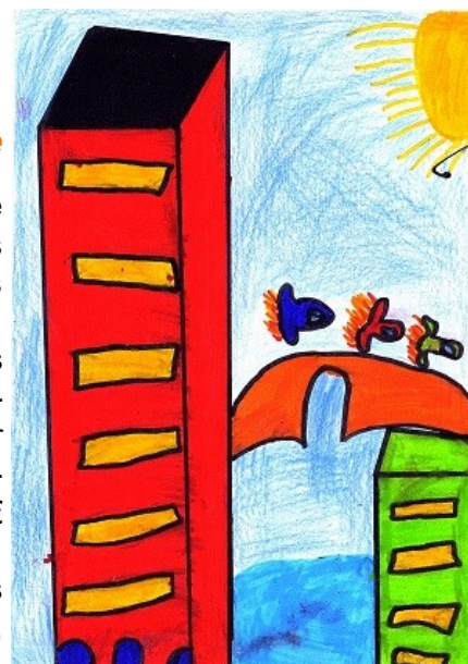
Dessin de Louis, CE2

Nous avons repris nos activités , en compagnie de certains habitants des villages environnants à savoir : belote, rummikub, skipbo, scrabble... pour les adultes et pour les enfants : des jeux correspondants à leur âge et à leurs désirs. L'horaire d'ouverture est 14h-18h avec une pause goûter vers 16h.