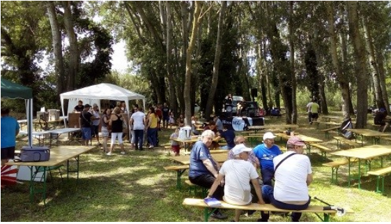
Le camping à l'occasion de la fête des vendanges 2018.

Havre de tranquillité et promenade ombragée pour de nombreux bélarganais l'été, aujourd'hui l'ancien camping municipal ne sert guère plus qu'aux festivités de l'été. Pourtant, il n'y a pas si longtemps encore, il regorgeait de campeurs qui venaient passer des vacances au bord de l'Hérault.