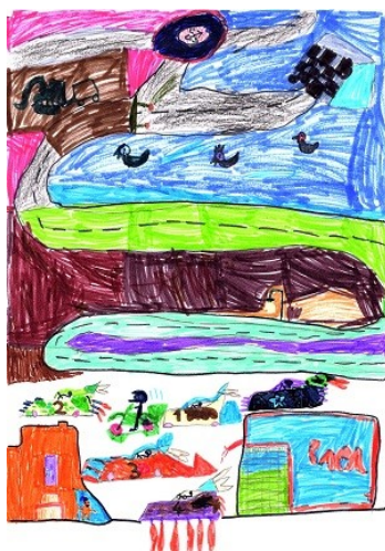
Dessin de Zanménou CP