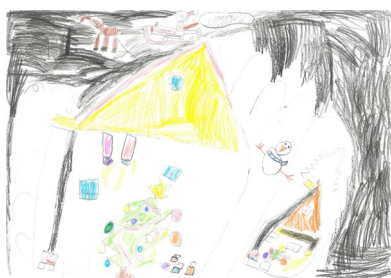
Classe des CP