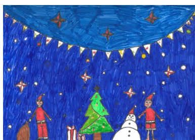
Classe des CE1-CE2